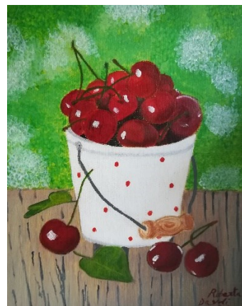
Le ciliegie per i nonni

Divertente spaccato della nostra infanzia, vi consiglio di leggerlo.