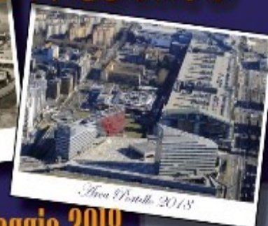
Area Portello 2018