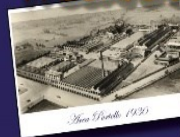
Area Portello 1926